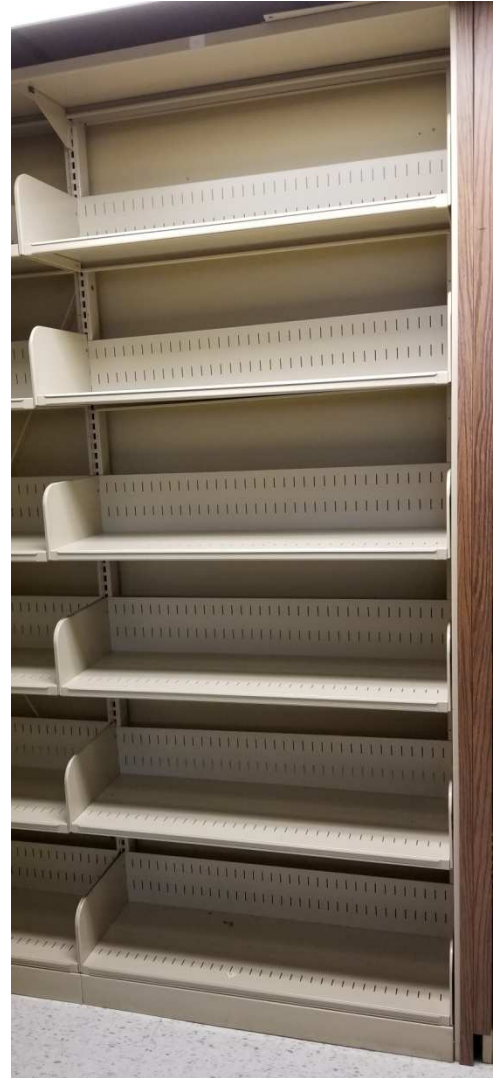
Toutes les bibliothèques ont 6 tablettes dont 5 sont ajustables. La tablette du bas est fixe.