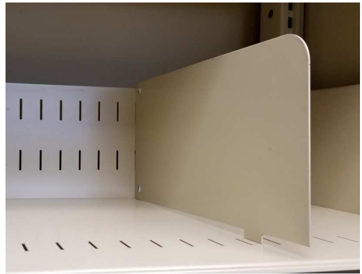
Des séparateurs de tablettes sont disponibles.