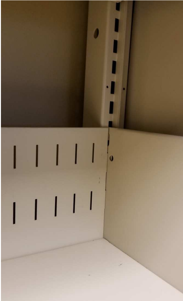
Les tablettes sont ajustables au ½ po (1,5 cm).