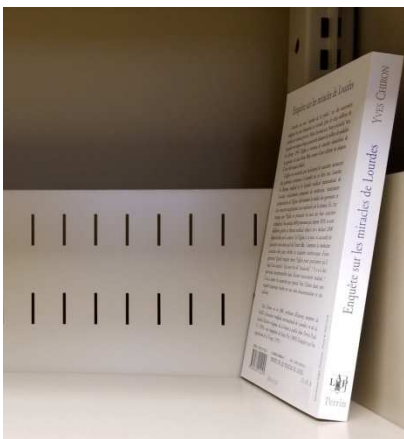
Dos de tablette prévenant la chute de documents entre la bibliothèque et le mur.