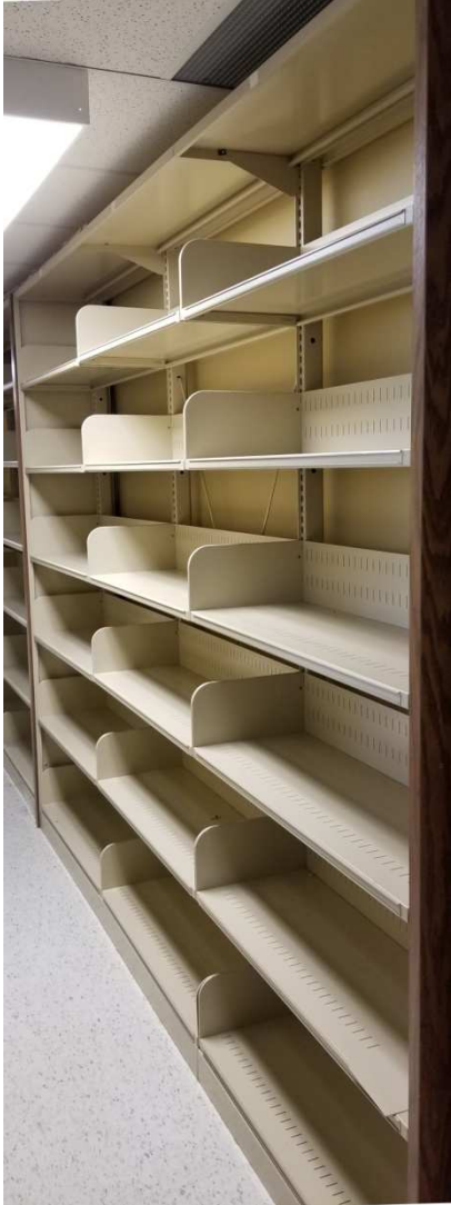
Modèle à trois sections.